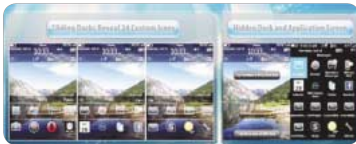
تجربه زندگی با شاتوت

یکی از مهم ترین ویژگی های این مرورگر جدید این است که داده های آن دو یا سه بار فشرده سازی می شود و بدین ترتیب، در مصرف شبکه صرفه جویی خواهد کرد. کاربران قدیمی بلکبری از این ارتقا بسیار راضی خواهند بود و این ارتقا از هیچ جهتی نسبت به نگارش قبلی ضعیف تر نیست و برای کسانی که از تلفن خود بیشتر برای ارسال و دریافت پیام استفاده می کنند، بهترین گزینه است.