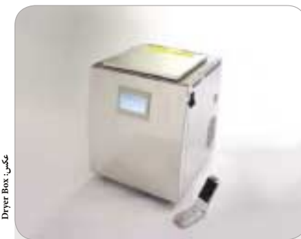
عکس: Dryer Box

تبلت‌های آید که در همان فضای آید کار خواهند کرد، با اندازه ۱۰ اینچی عرضه خواهند شد و زیر ۵۵۰ دلار قیمت‌گذاری شده‌اند. البته در مورد تفاوت‌های این دو صحبتی به میان نیامده و تنها گمان می‌شود نگارش ارزان‌تر با سیستم‌عامل اندروید باشد و نگارش گران‌تر آن با ویندوز 7 Embedded Compact عرضه شود.